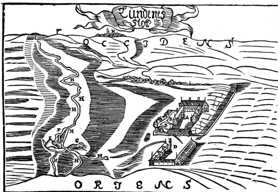
Kongens tilstedeværelse i Vestjylland, det mægtige Lundenæs Slot, lå også hvor Skjern-åen løber ud i Ringkøbing Fjord. Bemærk engene og markeringen af laksegårde (H), der udgjorde grundlaget for slottets økonomi.

Eng føder ager , der handler om, hvordan høet fra engene var fundamentet for studeopdræt, landsdelens eksportvare. For det andet var stude- og kvægholdet og de deraf følgende naturlige biprodukter nødvendige i rigt mål for at få agerjorden til at bære en beskeden kornavl til lidt selvforsyning. Denne grundpræmis for vestjysk landbrug, der holdt sig til mergling, kartofler og hedeopdyrkning vendte op og ned på alting i årene omkring 1900, satte også dagsordenen for Lønborggård.