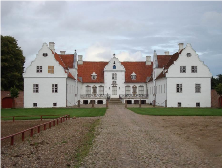
Herregårdene Bidstrup ved Langå (øverst) og Sostrup ved Grenaa (nederst) er en af fire herregårde, der, i forbindelse med kulturby-projektet Herregårdene – Porten til Europa, slår dørene op for publikum i 2017.

De bedste hilsner fra Gammel Estrup - Herregårdsmuseet